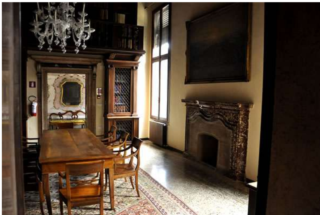
Sala del Caminetto